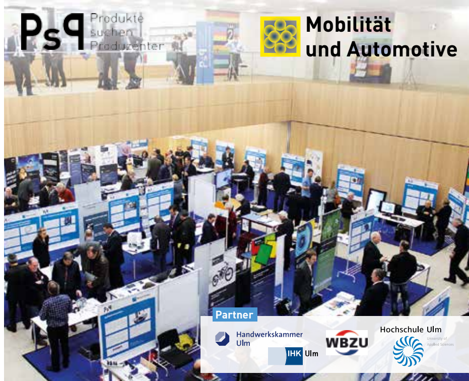
Symbolbild-Gestaltung: Alfred Lutz

Weitere Informationen und die Anmeldeunterlagen finden Sie unter www.produkte-suchen-produzenten.de .